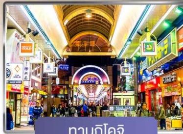
ทานุกิโคจิ